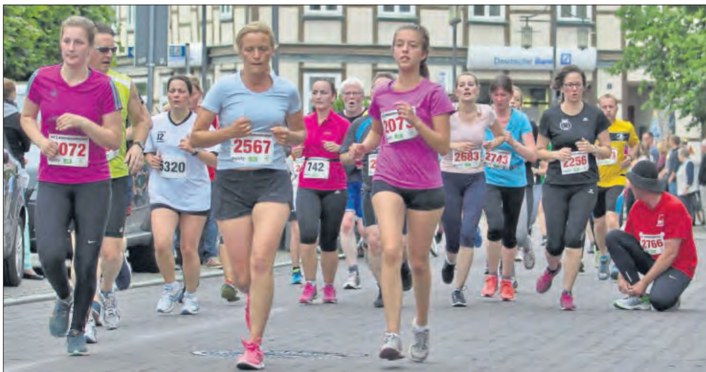
Das Aushängeschild des Uelzener Sports: 2562 Läufer haben sich für den heutigen AZ-Abendvolkslauf angemeldet. Zum neuen Rekord fehlen nur zwölf Nachmeldungen. Bei 200 Nachzüglern 2016 sollte das kein Problem sein.